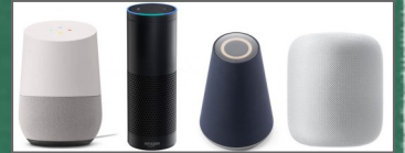
(スマートスピーカー)

IoT機器のIDとパスワードも購入時のままの設定にしておかず必ず変更してください。